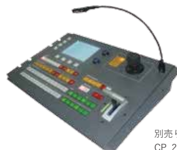
別売りオプション CP 2048