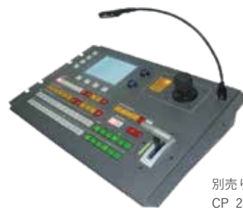
別売りオプション CP 2048